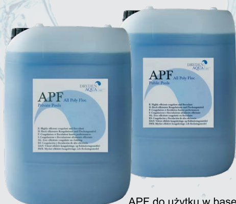
APF do użytku w basenach prywatnych i publicznych

Dla uzyskania najlepszej koagulacji i flokulacji