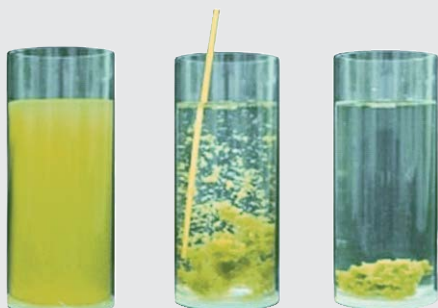
Przykład procesu flokulacji

Żaden pojedynczy flokulant lub koagulant nie może usunąć z wody wszystkich zanieczyszczeń. APF jest precyzyjnym połączeniem 6 różnych elektrolitów i polielektrolitów w celu zapewnienia możliwie najszerszego zakresu działania. Rozpuszczone składniki wody stanowią 80% zapotrzebowania na dezynfekcję a zawieszane cząstki stałe około 20%. Nie wszystko, co może być odfiltrowane wymaga utleniania, np. zanieczyszczenia nieorganiczne. Przy prawidłowym stosowaniu APF w połączeniu z AFM®, zużycie chloru i tworzenie niepożądanych produktów ubocznych dezynfekcji zmniejsza się nawet do 80%.